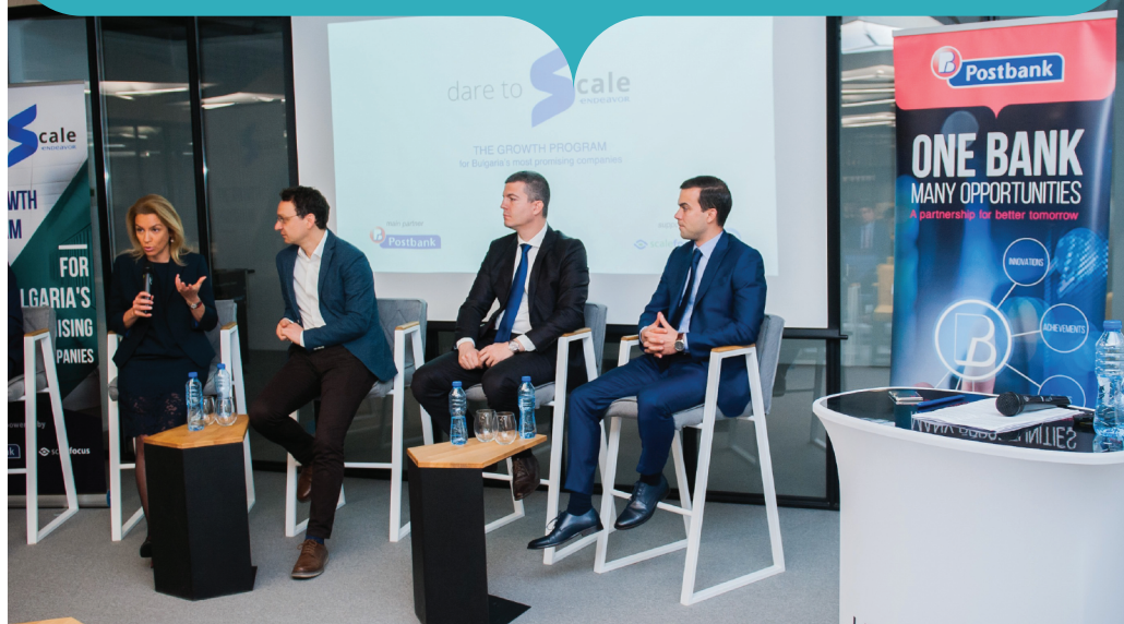
Официално представяне на програма Dare to Scale

Всеки ден срещаме млади хора с идеи за свой бизнес, стремеж да го направят успешен и амбиция да се развият – не само на българския пазар, но и в глобален план. Те обаче имат нужда от доверен партньор, сериозна подкрепа и от допълнителни ресурси, за да се възползват пълноценно от всички съществуващи възможности и