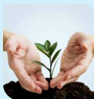
Продължава от стр.1

Инициативата обединява повече от 200 институции от над 40 страни, като спомага за диалога между широк кръг финансови организации и допринася за постигането на баланс между икономическия рас-