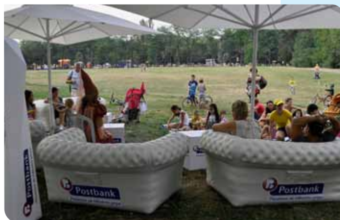
Докато малчуганите играят, роделите им могат да почетат любима книга