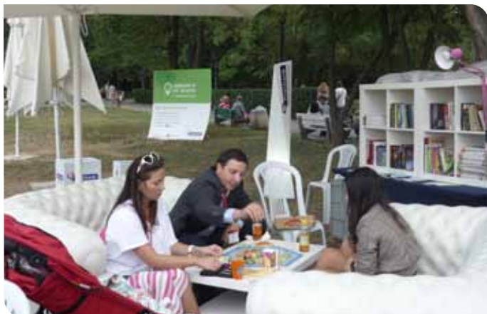
В разгара на играта „Заселниците на Катан“