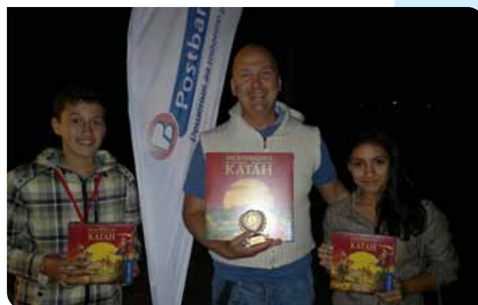
Победителите в първия турнир по Катан