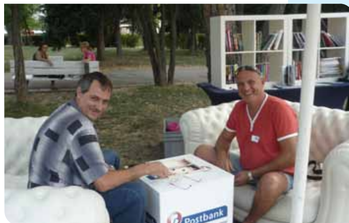
Участниците в първия турнир по табла се насладиха на приятна игра на открито