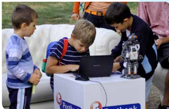
С училище по роботика Roborartans децата програмираха сами роботи

Пълната програма на събитията, както и регламент за участие в турнирите, ще публикуваме на нашата фейсбук страница facebook.com/PostbankBG .