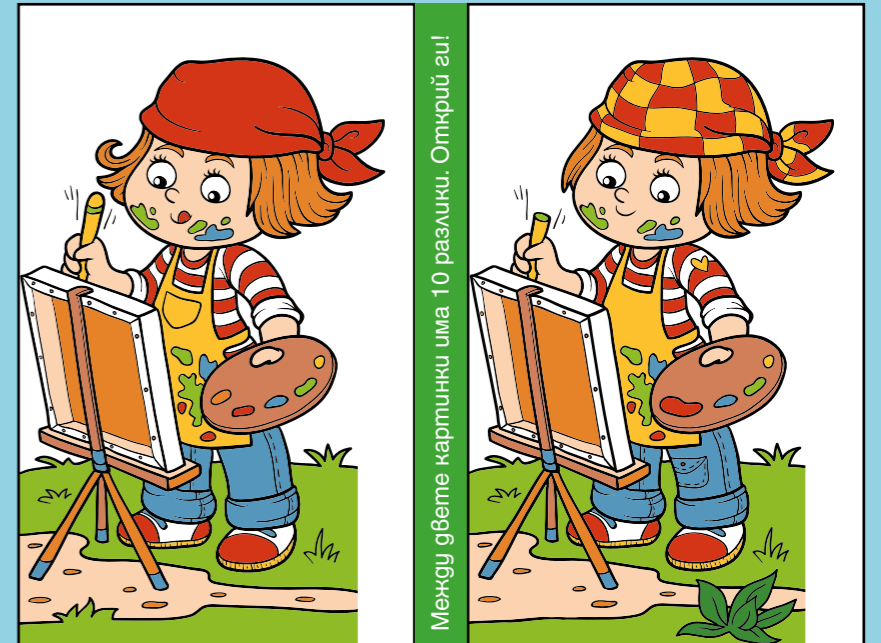
Между двете картинки има 10 разлики. Открий ги!

Помогни на Нагето да стигне до погводницата!