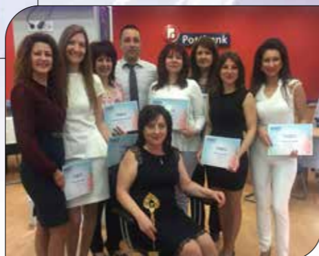
Екипът на най-добрия клон за 2017 a – клон „Стара Загора – Театър“

В рамките на събитието бяха отличени и най-добрите ни клонове. Колегите получиха грамоти и статуетки за своето отлично обслужване, високи познания и експертност, с които консултират нашите клиенти.