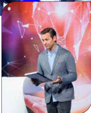
Един от най-обичаните артисти в България – Орлин Павлов – беше част от празника ни

Мотивиращите презентации на топ мениджърите бяха последвани от изненадваща тимбилдинг част, по време на която мениджърите на банката се забавляваха заедно, отговаряйки на въпроси, свързани с дигитализацията в банковия сектор и модерните продукти на банката.