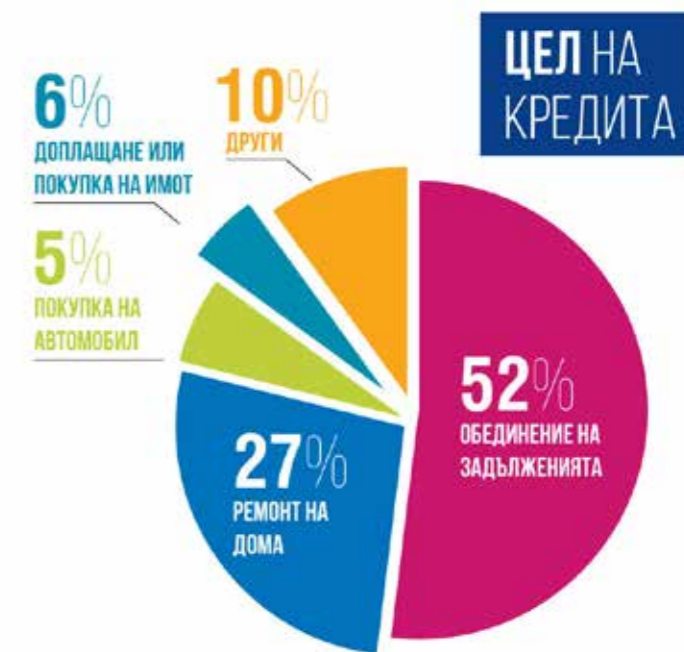
Данни на Пощенска банка за първото тримесечие на 2018 г.

Заедно с обединението на задълженията другата най-честа причина за кандидатстване за потребителски кредит е ремонт и обзавеждане на дома – над 27% от отпуснатите кредити. Следвани от кредити за доплащане или покупка на