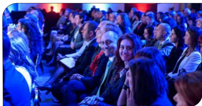
Събитието събра близо 400 мениджъри от клоновете и Централата на банката в цялата страна

В рамките на събитието бяха отличени и най-добрите ни клонове. Колегите получиха грамоти и статуетки за своето отлично обслужване, високи познания и експертност, с които консултират нашите клиенти.