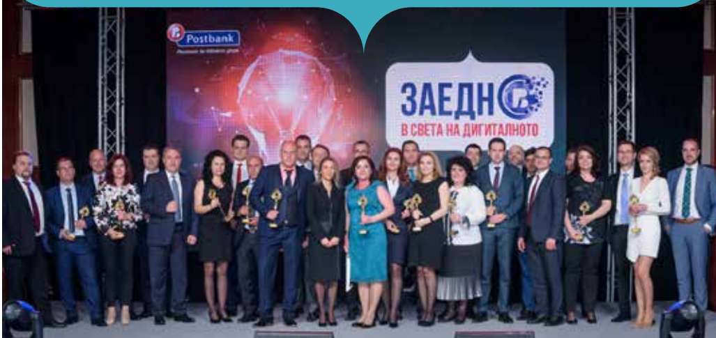
Управителите на най-добрите клонове за 2017 г. с мениджърката на Пощенска банка