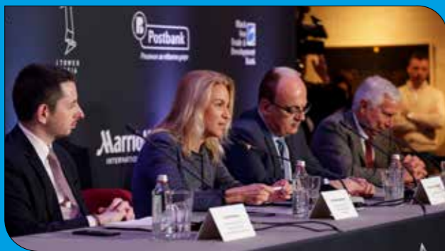
Продължава от стр. 1

На официалното събитие за подписването на договора присъства министърът на финан-