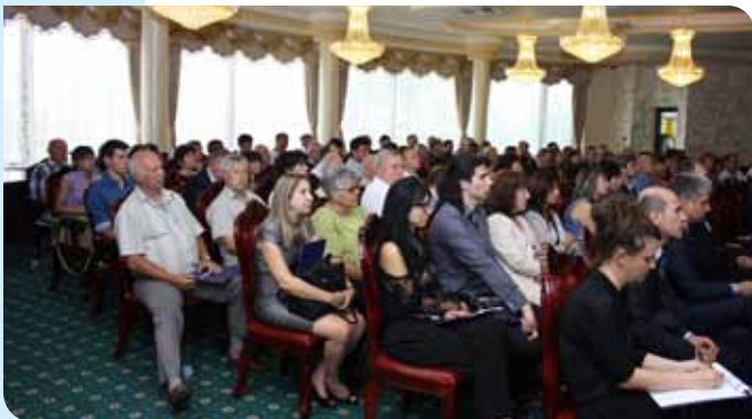
Срещата предизвика интерес от страна на бизнеса