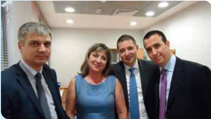
Екипът от централата на посещение в клон Стара Загора – театър