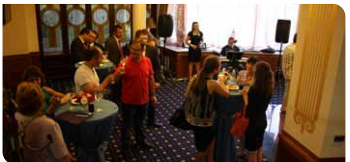
Гостите на събитието в приятна атмосфера на Парк Хотел Стара Загора