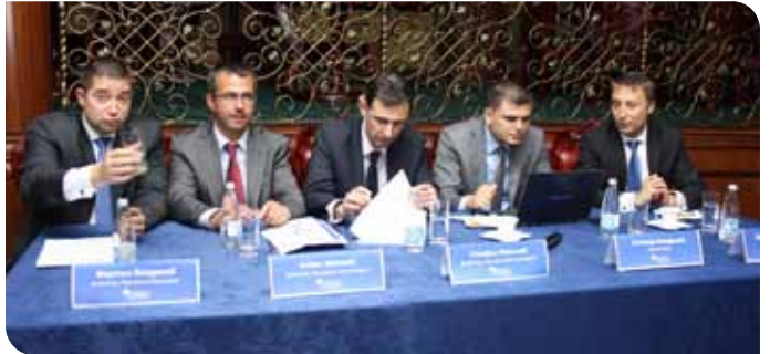
Лекторите на бизнес срещата „Решения за твоето утре“