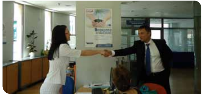
Клон Стара Загора на бул. „Цар Симеон Велики“ 107А