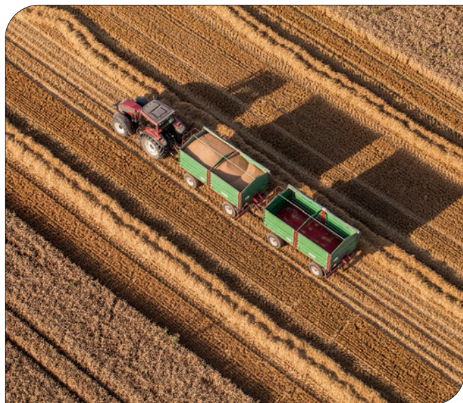
схема с до 50% покритие от НГФ от размера на одобрения кредит, който е в лева и ще се отпуска както за посрещане на нуждите на предприятията от оборотни средства, така и за реализиране на инвестиционни проекти.

Селското стопанство винаги е било в центъра на дейностите, финансирани от бюджета на ЕС, а по данни на БНБ през последните години аграрният сектор в България бележи значително развитие, като общият годишен обем на земеделското кредитиране срещу субсидии възлиза на около 80 млн. евро. Нашата банка подписа ново споразумение с Националния гаранционен фонд по втората гаранционна програма за земеделски производители, която се осъществява с финансовата подкрепа на Министерството на земеделието и храните. Споразумението е за издаване на гаранции по отпусканите от банката кредити за допълване на обезпечението на земеделски производители от секторите „Животновъдство“ и „Растениевъдство“. Гаранционният лимит на кредитополучател е до 3 млн. лв. Програмата представлява гаранционна