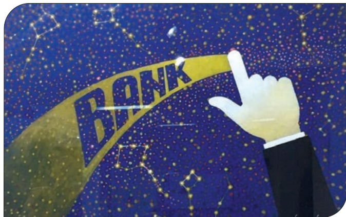
Автор: Лука Логатор, Черна гора

файл на телефон или компютър чрез нова модерна технология. До този момент над сто майстори на рисувания хумор от всички континенти са изпратили повече от 600 рисунки за Фестивала. На първата изложба в Бургас, на която присъства и г-жа Силвия Костова, началник управление „Корпоративни комуникации и маркетинг“ в Пощенска банка, бяха показани творбите на 200 от тях.