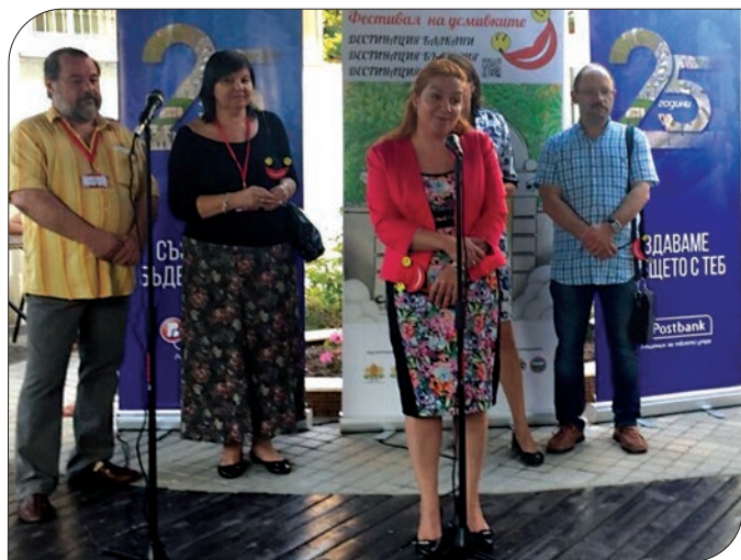
Официално откриване на фестивала в Бургас

Нашата банка подкрепя провеждането на международния Фестивал на усмивките, чиято основна цел е до края на 2016 г. да усмихне посетителите на изложбите на карикатури в 5 български града – Бургас, Пловдив, Стара Загора, Русе и София.