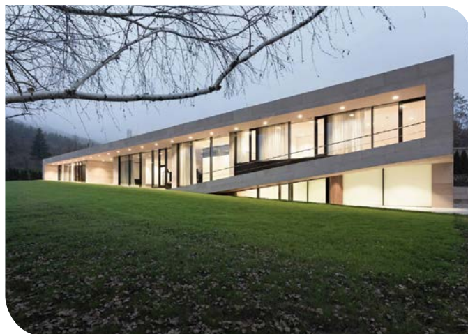
Домът, отворен към природата