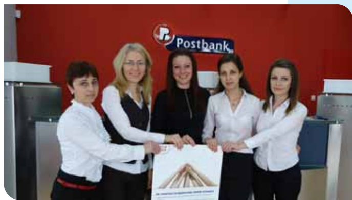
Клон Офис парк – София (в централата на Пощенска банка)

Хартата е поставена на видно място във всеки един клон на банката в цялата страна, с личния подпис на всеки служител в съответния клон, така че всички клиенти и посетители свободно да могат да се запознаят с принципите на работа на Пощенска банка.