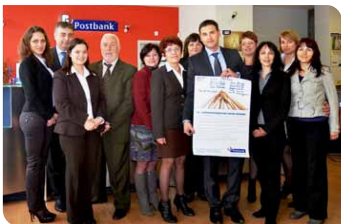
Екипът на Пощенска банка в Щумен