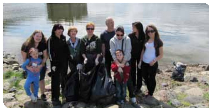
Екипът на „София-град“ е един от най-ангажираните с каузата

Благодарение на усилията им местата около спирка „Плажа“ и Гребната база вече са в много добро състояние, а от тазгодишното почистване на района около язовирната стена са събрали близо тон боклуци.