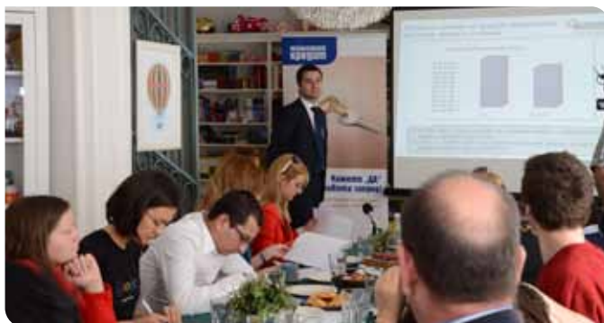
Анализите в доклада на Пощенска банка предизвикаха интерес и станаха обект на дискусии по време на представянето

Финансовата институция стартира регулярно изготвяне и представяне на тримесечни обзорни доклади, които ще бъдат обществено достъпни на сайта на банката – www.postbank.bg .