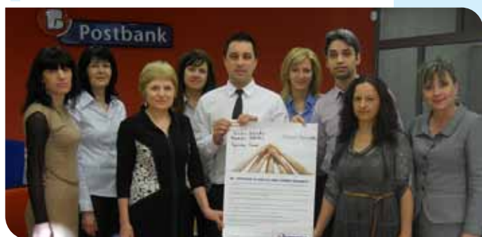
Екипът на клон Стара Загора Театър