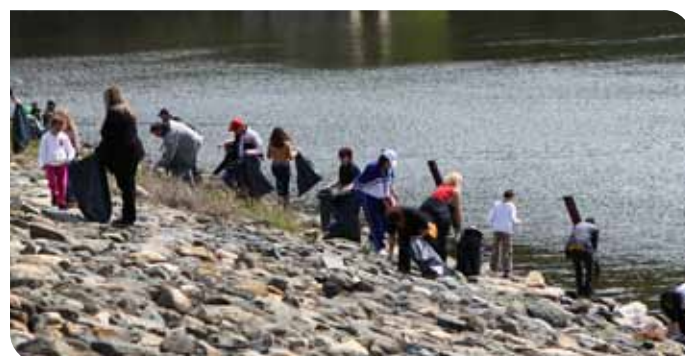
В почистването с ентузиазъм се включиха и малки, и големи