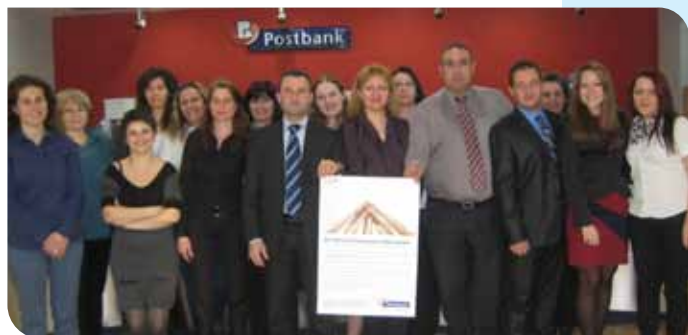
Първият клон на Пощенска банка – София град