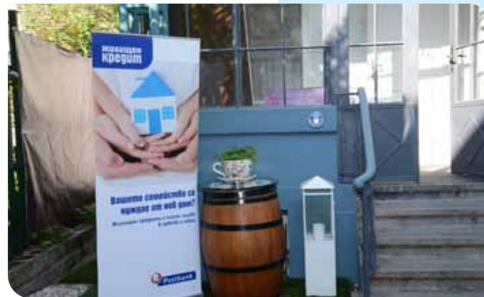
Избрахме символично място за представянето на доклада пред медиите

Средният размер на усвоените кредити в евро за първото тримесечие е 29 000 евро – много близък до средния размер за 2012 г. и с 10 000 евро под нивата от пика в края на 2008 г. София продължава да е основният град за жилищното кредитиране с над 40% от общо отпусна-