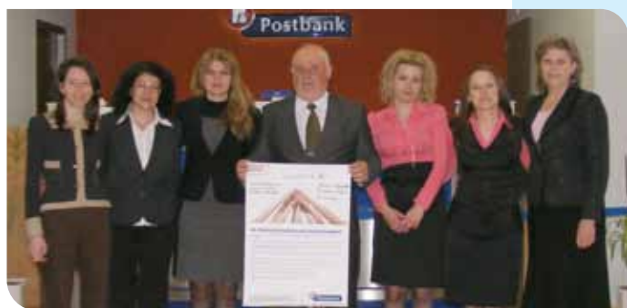
Клон Нов център - Смолян